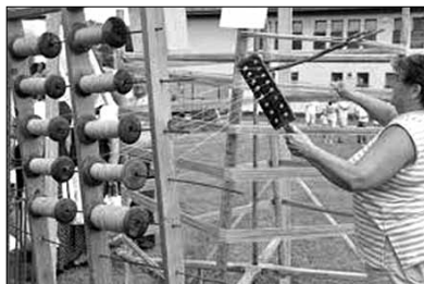
Snovadnica (na nej vľavo su fajfi)