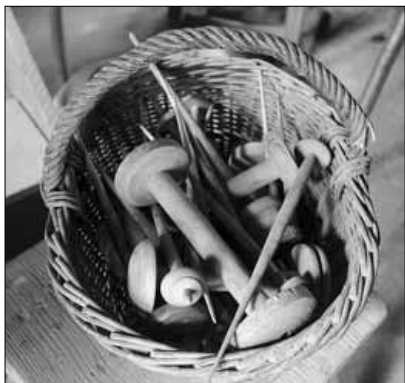
Fajfa (večše v kořariku je fajfa, menře vrecenko)

Predzu vecka povibirali, oplukali u vodze a na pracej lavkoj z drevenim pistom vitrepali, dokedi neišla čista voda. Vecka predzu visušili, našpuřali na špuřaru na fajfi a tak porichtovali na tkaře.