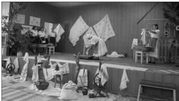
Udržiavanie ľudových tradícií v našej obci

robic ordung - upratovať taka jak pertena - pohodlná taka jak beštejla - prefíkaná taki jak bunkov - je ťažký idze jak paripa - ide vzpriamene taki jak ceľe, ľem mu ucha brinkaju - opitý na mol taki jak grof Ufri - namyslený